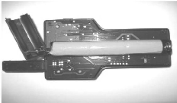
Replacement battery pack shown installed